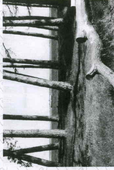
Tuse Næs